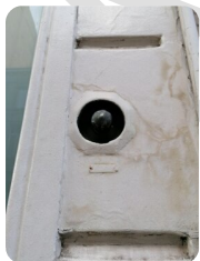
Foto 7: In welke straat en huisnummer vindt u deze originele huisbel?