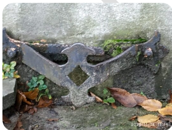
Foto 11: In welke straat en welk huisnummer vindt u deze voetschraper terug?