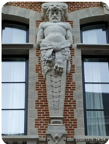
Foto 9: In welke straat en welk huisnummer vindt u dit beeld terug?