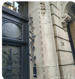
Foto 4: 1) In welke straat en huisnummer vindt u deze bel? 2) Van welke boom is dit blad?