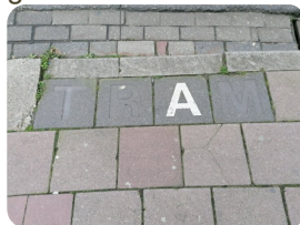
Foto 8: In welke straat en ter hoogte van welk huisnummer vindt u deze afbeelding terug?